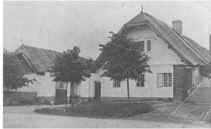
Dům č. 12 - u Skřivanů

a 1935, které byly poznamenány katastrofálním suchem. Následná neúroda, hospodářská krize celou tíživou situaci jen umocnily.