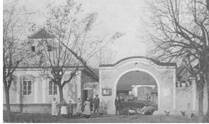
Dům č. 1 - statek u Šimečků

Prudký rozmach zemědělství za I. republiky si vynutil i postavení nové mostní váhy uprostřed obce (1933). I mechanizace si prorazila cestu na český venkov. Pluhy, kosy a hrábě postupně nahrazovaly sečí stroje, mlátičky a samovazače. Jen rozmary počasí se neměnily a práci zemědělců jen ztěžovaly. Dokladem toho bylo např. krupobití v noci z 31. května na 1. června 1931, které prý nemělo pamětníka. Žalostné byly pro vestecké i roky 1934