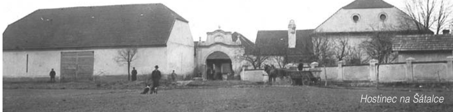
Hostinec na Šátalce