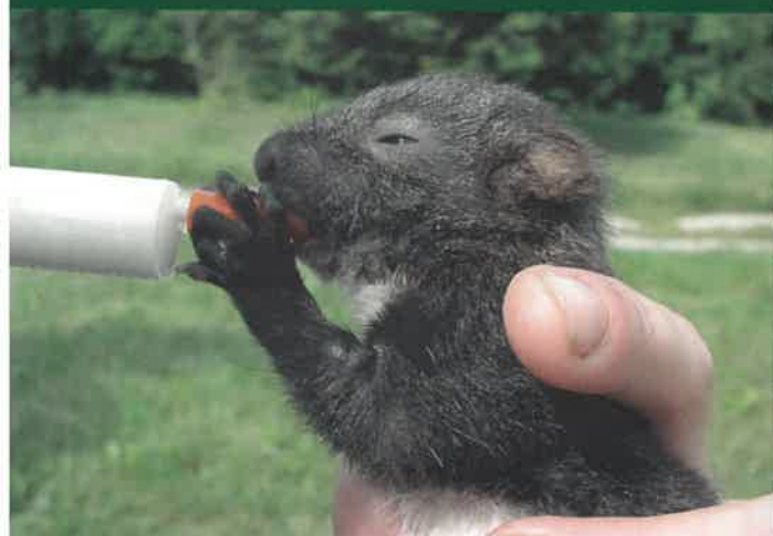
↓ Mládě veverky obecné

U mnoha druhů volně žijících živočichů je běžné, že rodiče nechávají své potomky i několik hodin o samotě, když shánějí v okolí potravu. Přestože se tak může zdát, že je mládě opuštěné, jeho rodiče jsou většinou nedaleko a pravidelně svého potomka krmí. Mezi takovými druhy patří například zajíci, srnky, kuny nebo ježci.