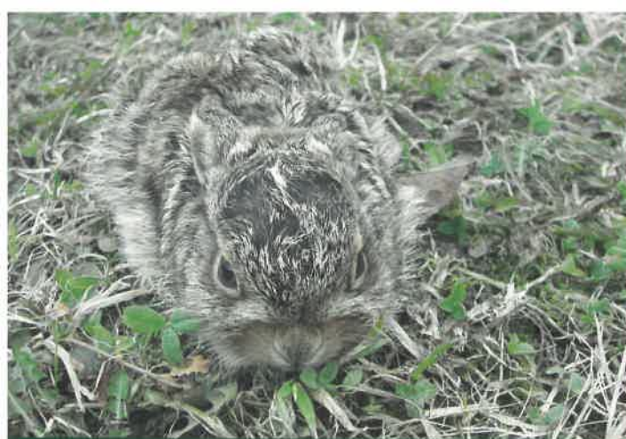
↑ Mládě zajíce polního

Do Záchrané stanice pro živočichy Českého svazu ochránců přírody Vlašim se každoročně dostávají desítky mláďat našich volně žijících druhů zvířat. Mnoho z nich však pravděpodobně lidskou pomoc nepotřebovalo a z přírody bylo vzato vinou lidské neznalosti přirozeného chování těchto zvířat. Lidé tak často ve snaze pomoci mláďatům vlastně uškodí.