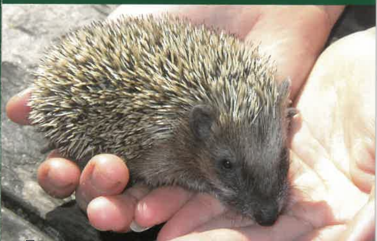
↓ Mládě ježka západního

Také mladé sovy a dravci neumějí zpočátku létat. Mláďata sov se zdržují ještě asi 4 – 6 týdnů po vylétnutí z hnízda na větvích kolem