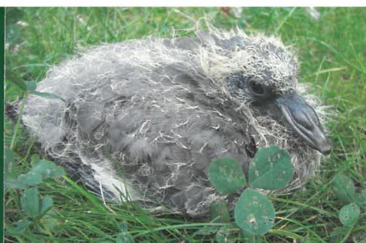
↑ Mládě holuba hřivňáče

Mláďata veverek, kun a ježků potřebují pomoc pouze tehdy, pokud bylo jejich hnízdo zničeno, pokud jsou zraněná nebo pokud jejich matka uhynula. Opuštěné mládě ježka, kuny nebo veverky se pozná podle toho, že píská, je podchlazené a osamoceně leze mimo hnízdo.