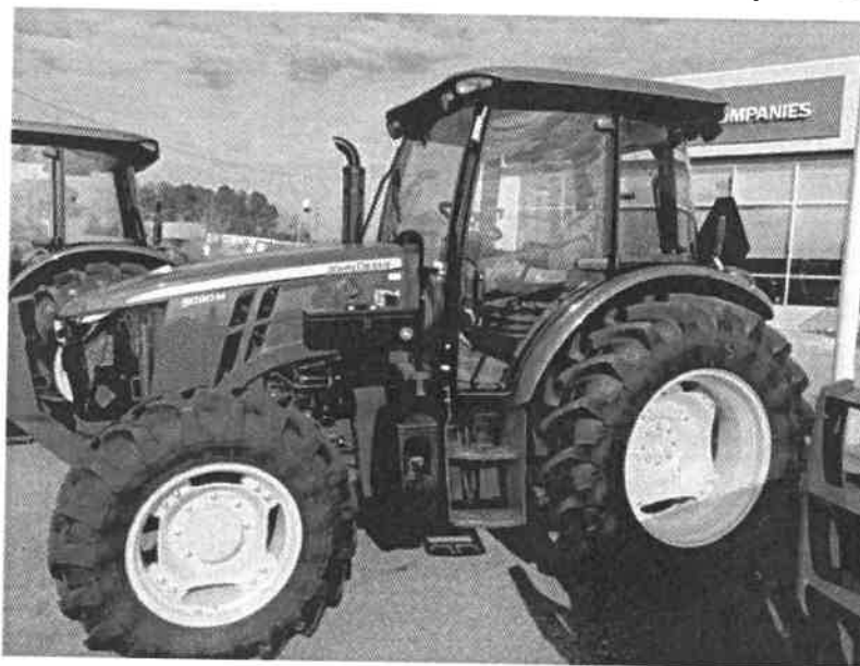
Obrázek 1: foto je pouze ilustrativní

Motor: čtyřválec PowerTech E 4,5 l konformní s emisní normou stupně III B, vysokotlaké vstřikování Common Rail, čtyřventilová technika, turbodmychadlo s mezichladičem stlačeného vzduchu, výkon 66,6 kW (90 k), při 2200 ot./min., horizontální výfuk. NUR-Diesel technologie.