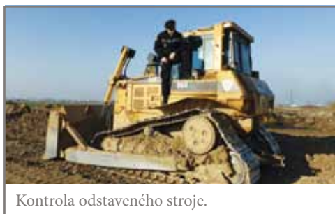
Kontrola odstaveného stroje.

V případě, že se dopustíte přestupku, raději hlídce zastavte a vyřešte tento skutek na místě. Když se rozhodnete ujet, riskujete nejen svoje zdraví, ale i zdraví a životy ostatních a díky záznamové technice budete stejně ve většině případu odhaleni. ■