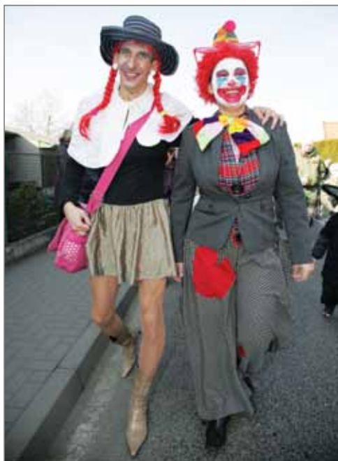
Vlevo žena a vpravo muž nebo snad obráceně?.