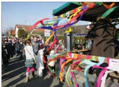
Občerstvení se vezlo na povoze.