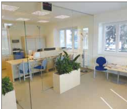
Vstup do nové podatelny.

Ti z vás, kteří měli možnost navštívit v posledních několika měsících budovu OÚ, jste jistě zaznamenali, že se něco děje. A nyní jsou již vidět i výsledky.