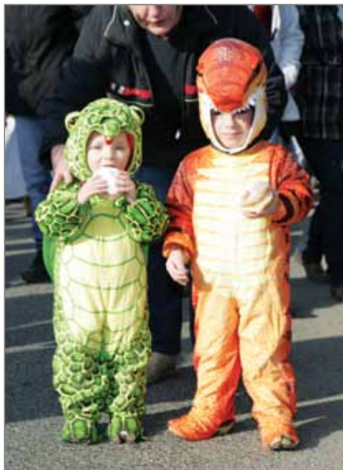
Povedené kostýmy zvířátek.

MŠ Vestec a obec Vestec vás srdečně zve na