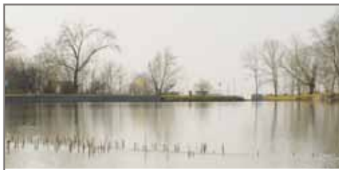
Pohled na vestecký rybník.

obytných schodů (mola) na hrázi o ploše cca 30 m 2 a vodních kol, která budou umístěna v prostoru lávky a bezpečnostního přelivu, dojde v na konci března k odpuštění vody z rybníka a snížení hladiny o cca 1 metr. Redakce Vesteckých listů bude sledovat, zda bude díky snížení hladiny potvrzena přítomnost vestecké lochnesky.