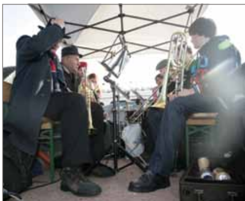
Živá hudba v průvodu.