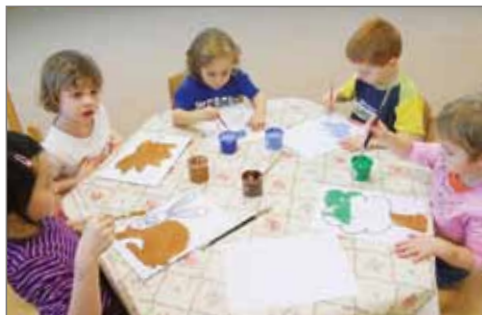
Malujeme ve žluté třídě.

o čem mluvím – několik let jsem byla ve funkci ředitelky. Tato osoba musí mít manažerské předpoklady, umět nadchnout celý kolektiv, mít promyšlené svoje záměry a plány, kam chce školu