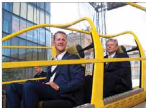
Michael Schumacher při testu nárazu vozidla.

Dále budete mít možnost si ve spolupráci s BESIP vyzkoušet simulátor převrácení vozidla a nárazu vozidla.