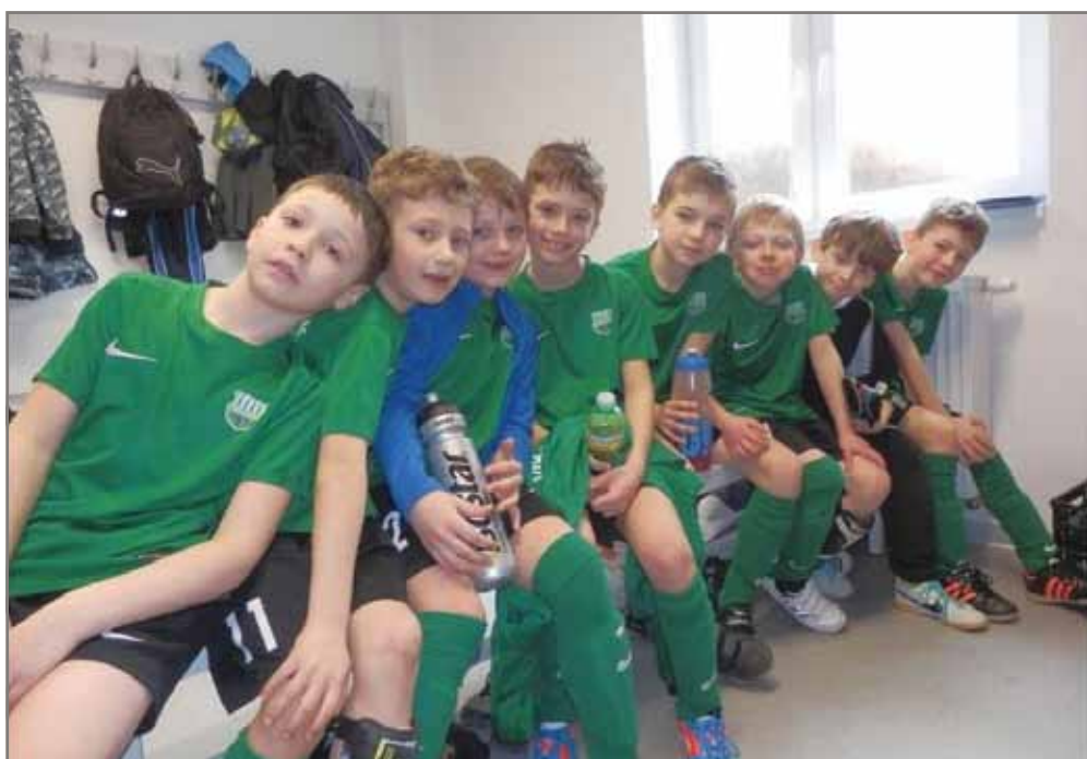
Momentka ze zimního turnaje.