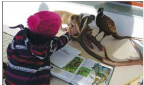
Děti měly možnost prohlédnout si zvířata.

Děti měly možnost vidět vycpaná zvířata, a tak si udělat představu, jak takové zvířátko vlastně doopravdy vypadá (jeho skutečná barva srsti, peří velikost těla,