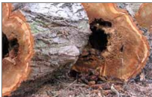
Včely v kmeni stromu.

Okolo našeho rybníka se pilně pracuje na realizaci úprav, o kterých jsme vás informovali v minulém čísle Vesteckých listů. Bylo vykáceno celkem 19 kusů stromů, z nichž některé byly v lokalitě nevhodné a další byly poškozené, kdy například