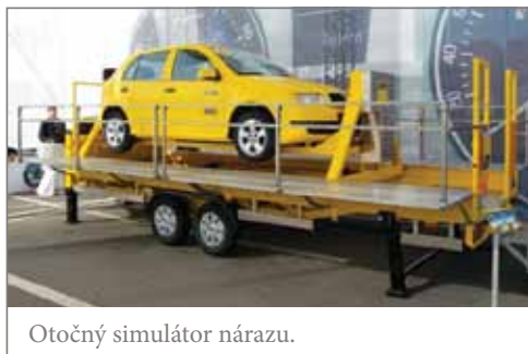
Otočný simulátor nárazu.

V rámci předvedení činnosti hasičů budete mít také možnost se projet na člunu HZS Jílové u Prahy po hladině rybníka.