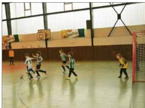
Vestecké dívky v akci.

nám naplánovat pravidelnou zimní přípravu. V příštím čísle vás podrobněji seznámíme s dívčím oddílem DFK Bohemians Praha 1905, který hraje také na hřišti TJ Viktoria Vestec. ■