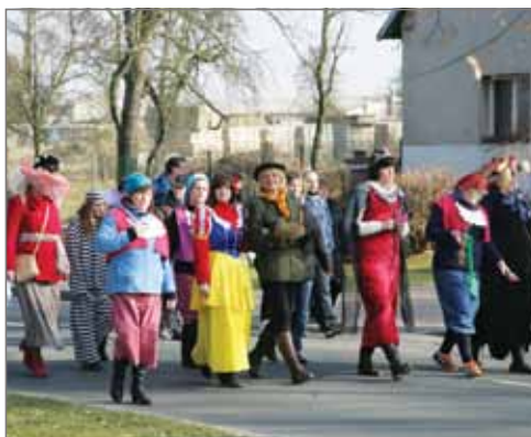
Průvod na Vestecké.