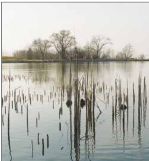
Rybník před snížením hladiny.