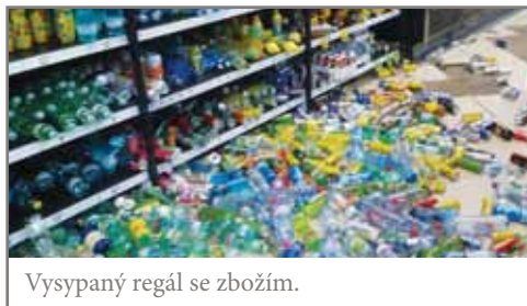
Vysypaný regál se zbožím.

Dávejte si pozor, i v relativním bezpečí nákupního centra se vám může stát nečekaná příhoda.