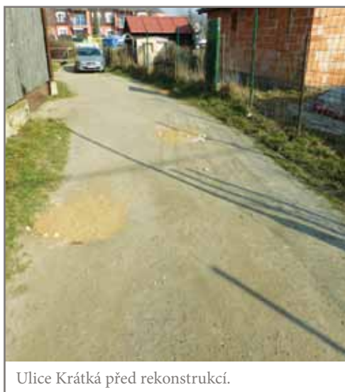
Ulice Krátká před rekonstrukcí.

Jedním z projektů, které budou realizovány v blízké době, je prodloužení a rekonstrukce ulice Krátká. V rámci těchto úprav dojde nejen k vybudování nového povrchu komunikace a úpravě chodníku pro pěší, ale také ke změně napojení, kdy ulice již nebude pro vozidla ústít na Vídeňskou, ale do ulice Na Suchých. Napojení na