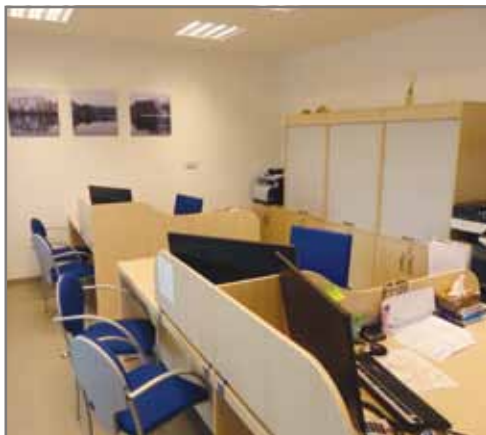
Přepážky v podatelně.

Za výrazného přispění zaměstnanců Technických služeb obce Vestec se podařilo zrekonstruovat větší část přízemních prostor, v současné době se ještě dokončuje sociální zázemí a prostory chodby.