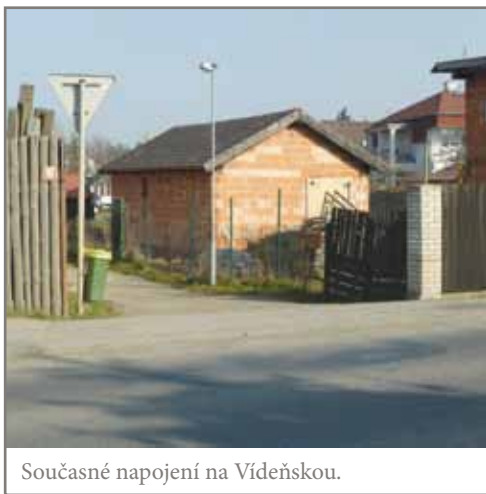
Současné napojení na Vídeňskou.

Na základě výběrového řízení byla uzavřena smlouva na prodloužení a rekonstrukci ulice Krátká se společností J.L.T.- stavební společnost, spol. s r. o. za cenu 1.039.653,59 Kč včetně DPH.