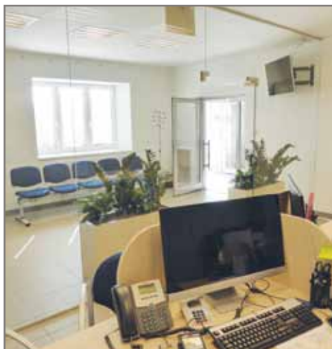
Pracovní zázemí v podatelně.

Původní prostory podatelny jsou nově využívány Obecní policií Vestec, zasedací místnost se změnila v novou podatelnu s kvalitním a moderním vybavením. Nová čekárna, tři přepážky řízené elektronickým vyvolávacím systémem, vždy vstřícné a příjemně naladěné pracovnice – co víc by si občan mohl přát. Na obecním úřadě si můžete vyřídit nejen záležitosti týkající se obce (platba poplatků, přihlášení k pobytu, sociální program), ale také využít služeb