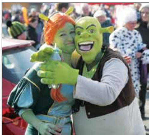
Shrek a Fiona ve Vestci.