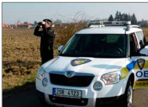
Obecní policie pro vaše bezpečí.

O realizaci a podmínkách této služby bude OP Vestec průběžně informovat na svých stránkách www.opvestec.cz ■