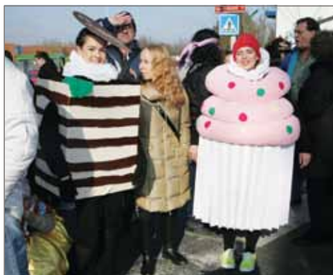
Dorazily i dortíky.