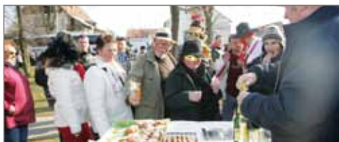
Zastavení u Škorpů.