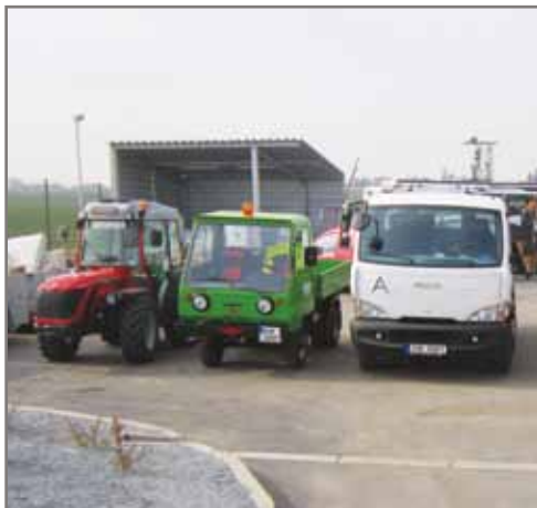
Vybavení technických služeb ve sběrném dvoře.

Své brány v únoru otevřel sběrný dvůr, který najdete v areálu Technických služeb obce Vestec. Jeho roční kapacita je 400 tun odpadu.