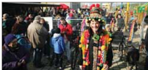
Laufer, neboli vedoucí průvodu.

Zazářili především členové Technických služeb obce Vestec, kteří přípravě věnovali mnoho volného času. Poděkování patří ale i všem, kteří se buď podíleli přímo na přípravě, nebo se zúčastnili v mnohdy opravdu povedených maskách a kostýmech, jak je patrné z následující fotogalerie. Masopust byl zakončen večerní zábavou v prostorách sportoviště a kolem půlnoci se poslední zbývající účastníci rozešli ke svým domovům.