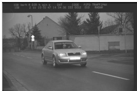
Měřicí zařízení projektu Bezpečná města zachytí každého neukázněného řidiče. Tento se v dubnu řtil obcí Plaňany rychlostí 108 km/h.

Jakub Hynek, mluvčí projektu Bezpečná města