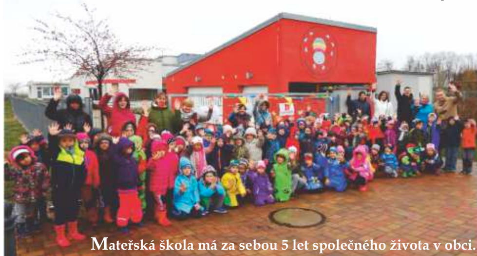
Mateřská škola má za sebou 5 let společného života v obci.